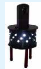
天井屋根裏等の点検用に考案された 360度撮影カメラ用照明付架台