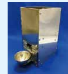
自動車生産ライン向け 部品自動供給装置