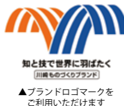
▲ブランドロゴマークを ご利用いただけます

川崎市経済労働局工業振興課 TEL044-200-2324 / FAX044-200-3920