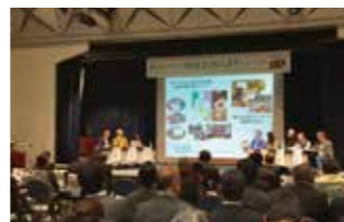
▲平成30年度は「生産者と消費者がつながるしくみ」をテーマに開催

川崎市経済労働局農業振興課 TEL044-860-2462 / FAX044-860-2464