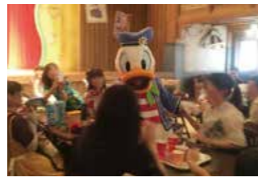
会員向けイベントの開催

川崎市経済労働局労働雇用部 TEL044-200-2275 / FAX044-200-3913