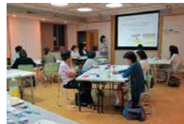
女性リーダー養成研修

川崎市男女共同参画センター(すくらむ21) TEL044-813-0808 / FAX044-813-0864