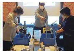
会員向けイベントの開催

川崎市経済労働局労働雇用部 TEL044-200-2275 / FAX044-200-3913