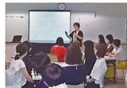
女性リーダーのためのマネジメント力強化研修

中小企業を対象に女性が就労継続し、キャリアを積み重ねながら、管理職として活躍する機会が増えるよう女性社員向け公開研修会を開催します。年間を通じて、事業所への出前研修・講師派遣も行っています。詳細はホームページをご覧ください。