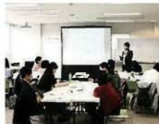
▲女性起業家の事業計画作成講座