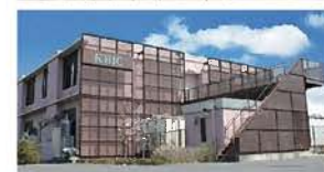
KBIC本館 インキュベーションラボ39室のほか3Dプリンター等の共用装置を設置