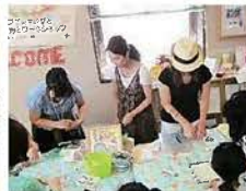
▲女性起業家ミニ見本市